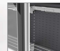
Barra para ganchos