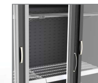
Barra carnicera (embutidos)