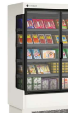
Lateral PLÁSTICO de serie PLASTIC side as standard