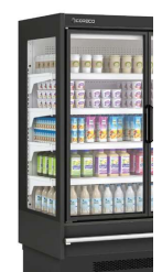
Lateral PANORÁMICO -LE opcional PANORAMIC side -LE on demand