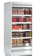
Lateral CERRADO -LC opcional BLIND side -LC on demand