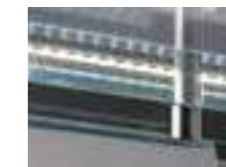
Optional kit LED