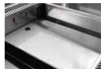
Optional ***73690012 Vassoio fondo (532x326) S/S Plate (532x326)