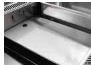
Optional ***73690012 Vassoio fondo (532x326) S/S Plate (532x326)