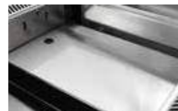
Optional ***73690012 Vassoio fondo (532x326) S/S Plate (532x326)