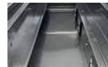
Nuova vasca studiata per facilitare l'assistenza e la pulizia. New well studied for easy service and an easy cleaning.