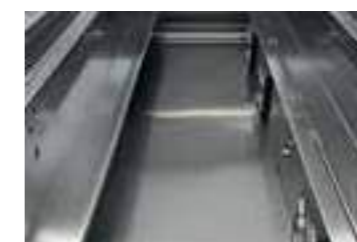
Nuova vasca studiata per facilitare l'assistenza e la pulizia. New well studied for easy service and an easy cleaning.