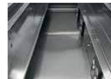
Nuova vasca studiata per facilitare l'assistenza e la pulizia. New well studied for easy service and an easy cleaning.