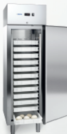
MOD. S PIZZA