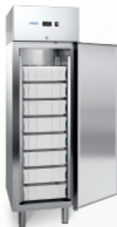
MOD. S PESCE