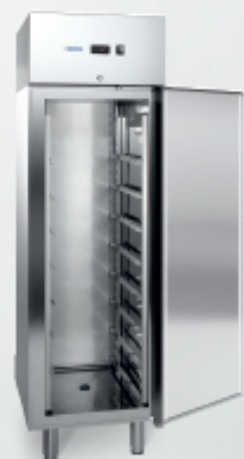
MOD. S EN