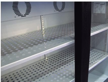
Estantes chapa perforada opcional SS shelves on demand