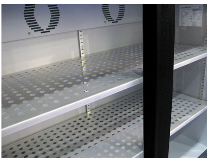
Estantes chapa perforada opcional SS shelves on demand