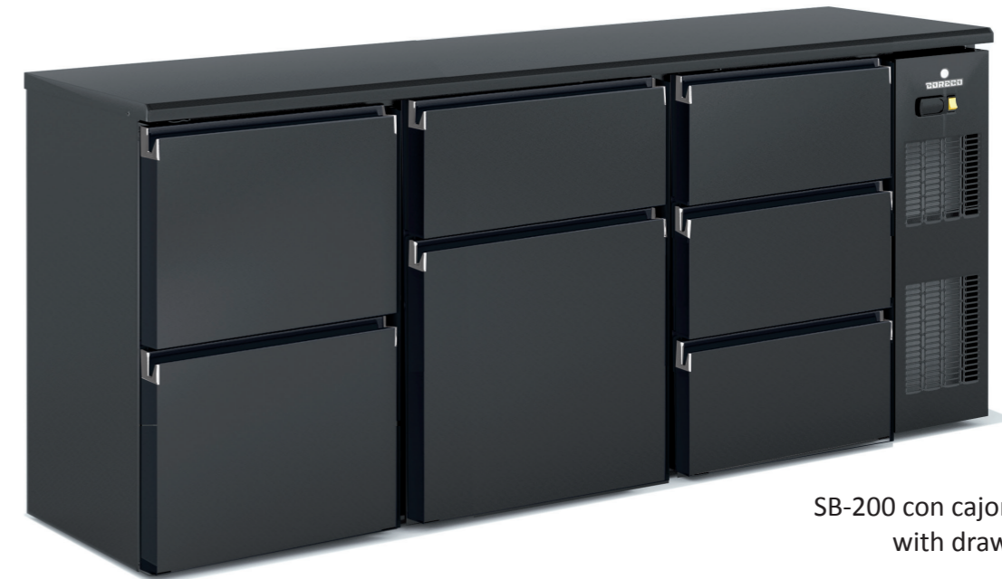
SB-200 con cajones with drawers