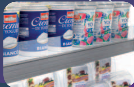
Spondine in cristallo. Crystal risers. Balconnets en verre. Kristallglasfrontscheiben. Bordes de cristal. Стеклянные бортики.