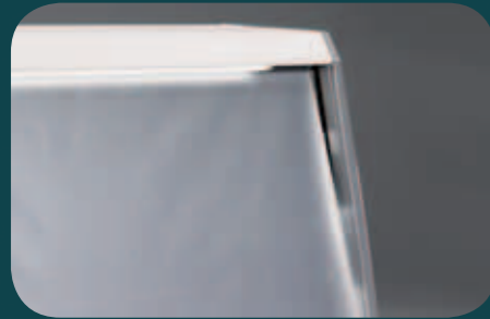
Tenda notte. Night blind. Rideau de nuit. Nachttrollo. Cortina nocturna. Ночная шторка.

Витрина с вентилируемым охлаждением для демонстрации напитков, колбасных изделий и молочных продуктов. Специально разработана для пищевых продуктов, чрезвычайно проста в транспортировке, специально предусмотренная ограниченная высота позволяет использовать ее в качестве прикассового прилавка.