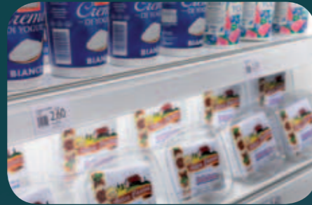
Portaprezzi trasparenti. Transparent tickets channel. Porte prix transparente. Transparente Preisschienen. Portaprecios transparentes. Прозрачные ценники.