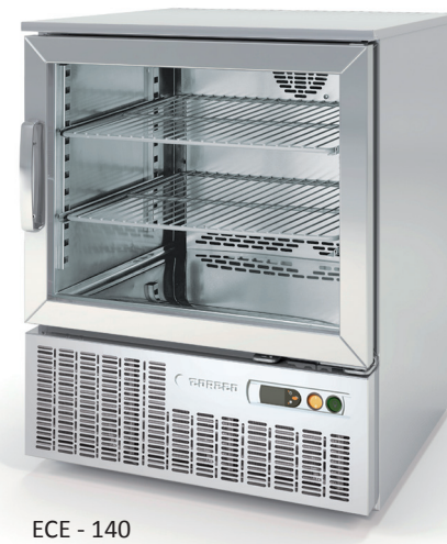
ECE - 140

all photos must be considered as a reference - fotografías no contractuales