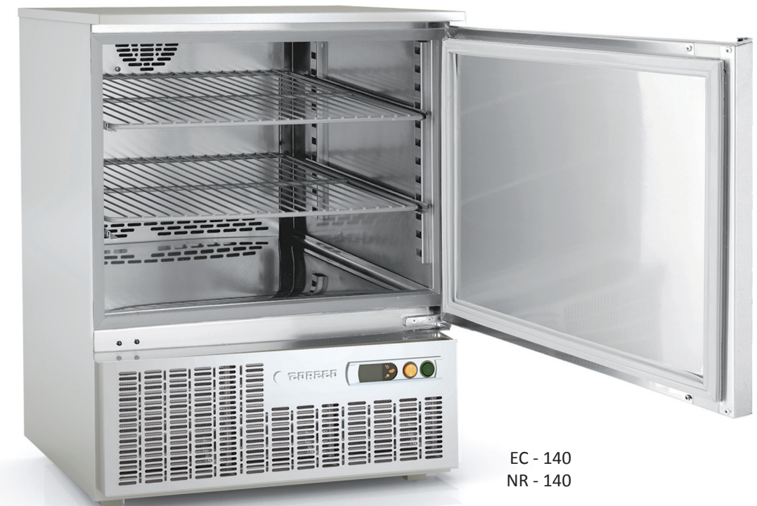
EC - 140 NR - 140

Interior y guías adaptadas a capacidad GN 1/1 Slides and interior, GN 1/1 compatible