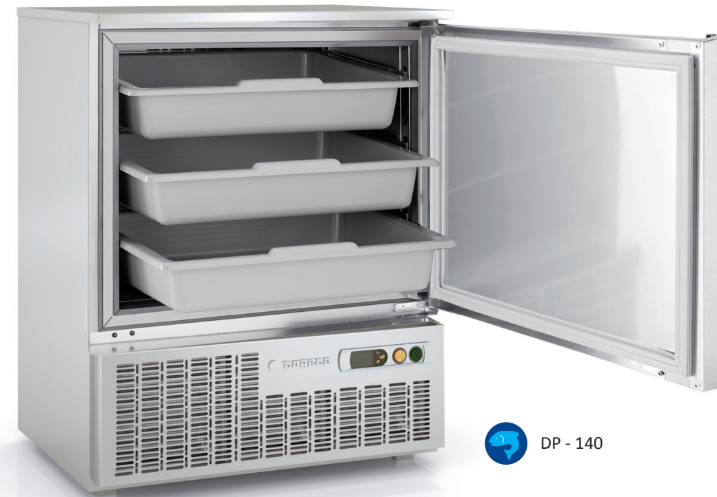
DP - 140

all photos must be considered as a reference - fotografías no contractuales