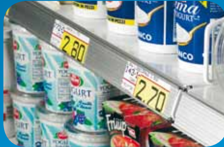
Portaprezzi in alluminio e plastica. Price holders in aluminum and plastic. Porte-prix en aluminium et en plastique. Alu- und Kunststoff- Preisschienen. Porta precios de aluminio y plástico. Держатели ценников из алюминия и пластмассы.