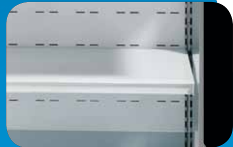
Ripiano aggiuntivo - Illuminazione ripiani. Extra shelf - Shelf illumination. Tablette supplémentaire - Éclairage étagères. Zusätzliche Etage - Auslagenbeleuchtung. Estante adicional - Iluminación estantes. Дополнительная полка - Освещение полок.