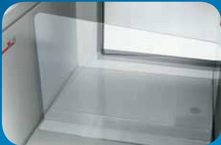
Spondine e divisori in filo. Wire risers and partitions. Balconnets et séparateurs en fil. Frontscheibe und Gittertrennwände. Bordes y tabiques de alambre. Бортики и делители из проволоки.

Пристенная горка «Argus Doors» с положительной температурой, благодаря своей небольшой высоте гарантирует обширный объем экспозиционной площади и отличную видимость выложенных продуктов. Холодильное оборудование с дверцами из стеклопакетов представляет собой ответ на новое растущее требование рынка, касающееся торгового оборудования, обеспечивающего существенное сокращение потребления энергии, в сочетании с улучшением эксплуатационных показателей хранения выложенных продуктов. Наличие стеклянных дверец способствует также улучшению комфорта покупателей, достигнутого благодаря сокращению ощущения холода при прохождении вдоль торгового ряда. Кроме того возможность «компоновки в линию» с другими моделями горок «Argus» усиливает гибкость ее использования и позволяет дифференцировать экспозиционную типологию.