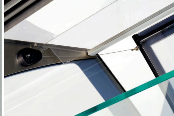
The reel for folding the front glass / Winde, um das Frontglas abzukippen