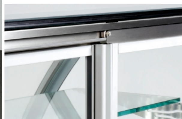
Detail of the door movement system / Tür-Verschiebung Detail