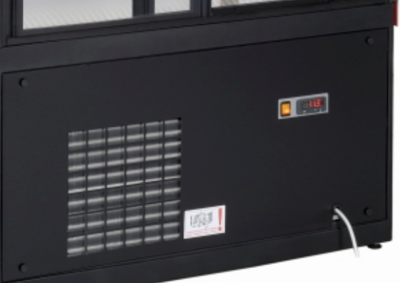
Rear view of showcase / Rückansicht auf das Glasschrank