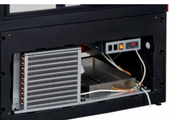
Cooling unit / Kaltwasserzeuger