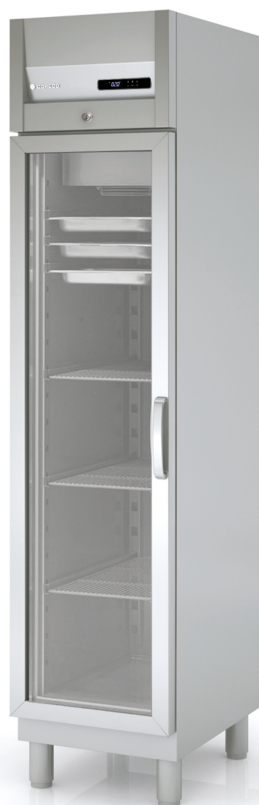
AGRE-50 (GN 1/1)